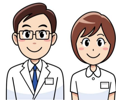
聖マリアヘルスケアセンター 患者サービス委員会