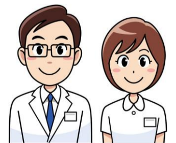
聖マリアヘルスケアセンター 患者サービス委員会